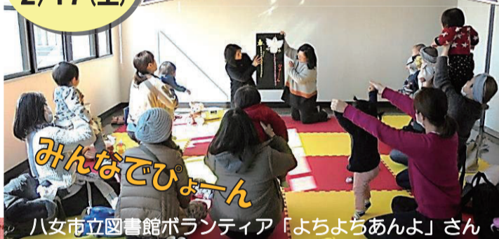
みんなであひょん 八女市立図書館ボランティア「よちよちあんよ」さん