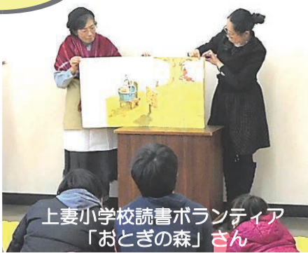
上妻小学校読書ボランティア「おとぎの森」さん

普段はそれぞれの小学校で活躍する読書ボランティアさんが、よみきかせをしてくださいます。大型絵本やエプロンシアターなど盛りだくさんの内容で、とても楽しい時間でした。