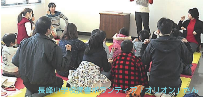
長峰小学校読書ボランティア「オリオン」さん