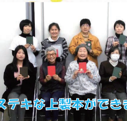
ステキな上製本ができました♡

2017年度のとしょかん大人塾も最後となりました。2月28日に開催した最終回はおたのしみ企画! 文庫本を上製本に仕立てる技術を学びました。