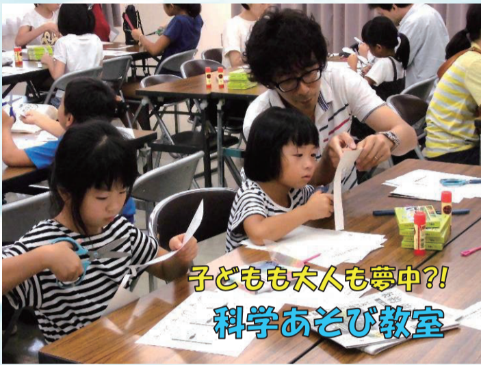
子どもも大人も夢中?! 科学あそび教室

8月20日(日)に科学あそび教室を実施しました。親子で参加出来る!と人気の企画で、今回はとっても不思議なバランスとんぼ作りに挑戦しました。ちいさな子どもたちも楽しめるとあって、あちこちのテーブルでお父さんやお母さんが大活躍!自分だけの可愛いバランスとんぼが出来上がりました。