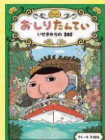
『おしりたんてい いせきからのSOS』 トルル/さく・え ポプラ社 (J913トロ)