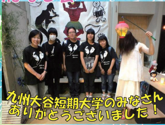
九州大谷短期大学のみなさん ありがとうございました!