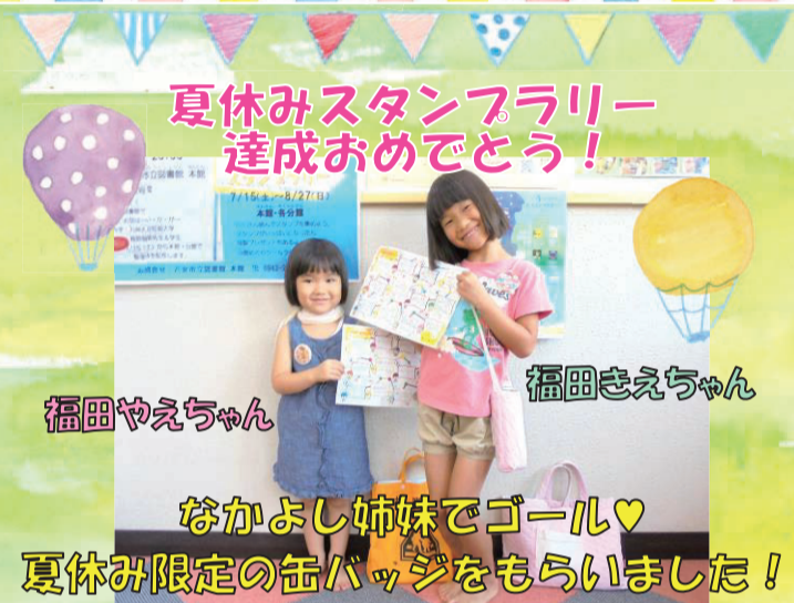
夏休みスタンプラリー 達成おめでとう!