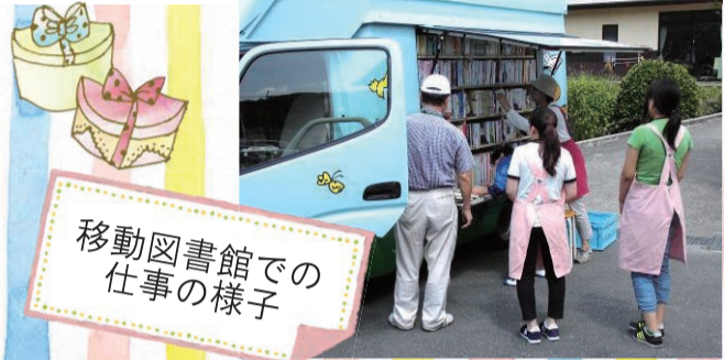
移動図書館での 仕事の様子

九州大谷短期大学から笑顔がステキな2名の学生が図書館実習にきました。将来は司書を目指すため、現場での業務を実際に体験します。10日間で様々な仕事を体験してもらいましたが、この実習を通してどんなことを感じたのでしょうか。この経験を今後の進路に役立ててほしいと思います。おつかれさまでした!