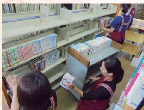
↑ 児童棚の配置換えの様子

蔵書点検の結果、本館で25点の資料がなくなっていることがわかりました。下記は、不明になっている本の一部です。図書館の資料は、市民の皆さんの大切な財産です。マナーを守って、気持ちよく図書館を利用しましょう。