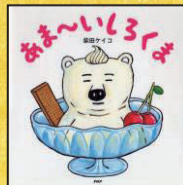
『あま〜いしろくま』 柴田 ケイコ/作・絵 PHP 研究所 (J Eア)