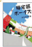
『帰宅部ボーイズ』 はらだ みずき/著 幻冬舎 (YA913ハラ)