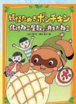
『妖怪たぬきポンチキン 化けねこ屋敷と消えたねこ』 山口 理/作 文溪堂 (J913ヤマ)