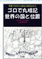
『ゴロで丸暗記 世界の国と位置』 矢島 舜孳/著 古今書院 (375ヤ)

9月1日~11日まで特別整理期間のため休館しました。期間中は蔵書点検や児童書棚の配置換え、天井灯の改修などを行いました。蔵書点検とは、図書館で所蔵している資料が正しい場所に収まっているか、行方不明のものが無いかを点検する作業です。八女市立図書館では、毎年1回この作業を行っています。